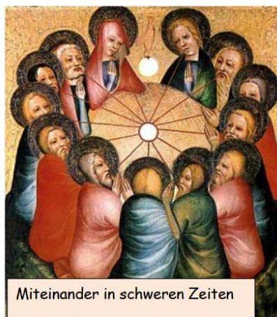
Miteinander in schweren Zeiten